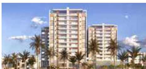
Residence Sunlight no Porto Novo