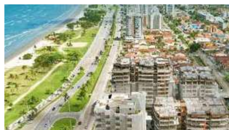
Calabasas Condominium Resort no Indaiá