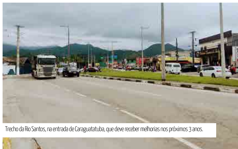
Trecho da Rio Santos, na entrada de Caraguatatuba, que deve receber melhorias nos próximos 3 anos.