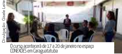
O curso acontecerá de 17 a 20 de janeiro no espaço CONEXÕES em Caraguatatuba