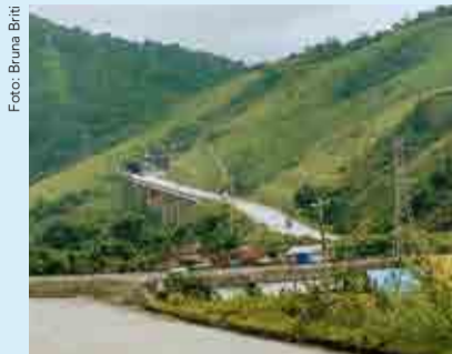
Obras do Contorno da Tamoios no trecho de Serra que liga Caraguatuba à Ubatuba.

As obras dos Contornos que liga São Sebastião, Caraguatuba e Ubatuba estavam paralisada desde 2018 sendo retomada