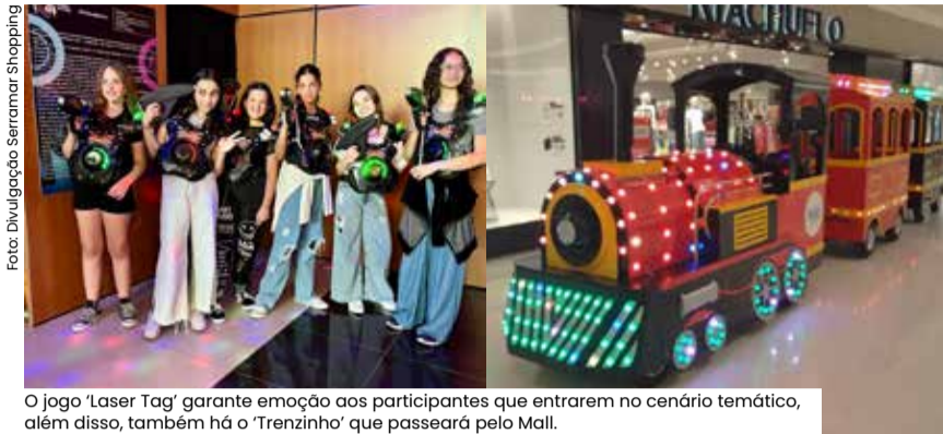
O jogo 'Laser Tag' garante emoção aos participantes que entram no cenário temático, além disso, também há o 'Trenzinho' que passará pelo Mall.

O ano de 2023 inicia com muita aventura e diversão no Serramar Shopping com os eventos 'Laser Tag' ao lado do Heroes Play, e o Trenzinho em frente à loja Renner, de 5 de janeiro até 05 de março. As atrações são para toda família.