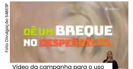
Vídeo da campanha para o uso consciente da água da SABESP.

Dicas importantes são destacadas na peça publicitária por meio de cenas didáticas que reforçam as atitudes conscientes de economia de água e promoção da sustentabilidade.