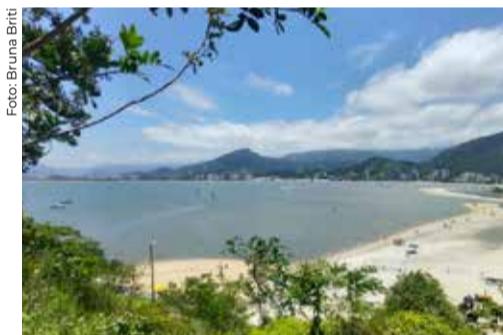
A Prefeitura tem investido em obras de Norte a Sul da cidade.

As obras da 2ª fase do Complexo Turístico do Camaroeiro foram retomadas em novembro último pela prefeitura. Nesta fase está prevista a construção do Centro Administrativo, com banheiros, e do Centro de Exposições, além de deck mirante, calçadas, infraestrutura elétrica e hidráulica. Também estão em andamento as obras na região do rio Juqueriquerê que somam R$ 42,5 mi e das fases II e III do Programa de Pavimentação "Caraguá em Obras" que somam R$ 45,4 milhões.