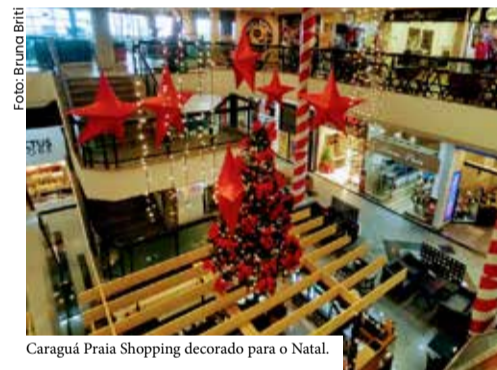
Caraguá Praia Shopping decorado para o Natal.

O Litoral Norte fica ainda mais movimentado nesta época. Fim de ano, todo mundo quer praia e diversão. Confira as ações do Caraguá Praia Shopping, do Serramar e da ACEC (Associação Comercial e Empresarial) de Caraguá que prepararam campanhas de Natal e Verão para presentear moradores e turistas somando 800 mil em vales-presentes e sorteio de carro 0km. O Supermercado Canto Bravo da Prainha, assim como outros comércios, também estão divulgando produtos natalinos de qualidade e com preços justos.