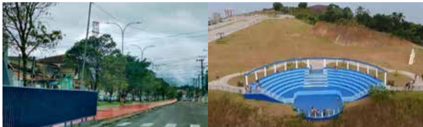
Pavimentação no Jardim Jaqueira e Teatro de Arena que compoem as obras do complexo turístico do Camaroeiro.

As obras da 2ª fase do Complexo Turístico do Camaroeiro foram retomadas em novembro pela prefeitura. Nesta fase está prevista a construção do Centro Administrativo, com banheiros, e do Centro de Exposições, além de deck mirante, calçadas, infraestrutura elétrica e hidráulica.