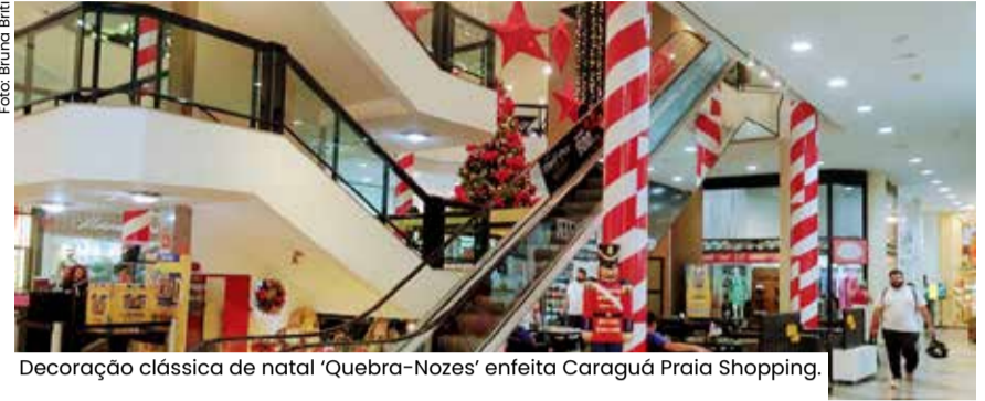
Decoração clássica de natal 'Quebra-Nozes' enfeitada Caraguá Praia Shopping.

O Litoral Norte fica ainda mais movimentado nesta época. Fim de ano, todo mundo quer praia e diversão. Confira as ações do Caraguá Praia Shopping, do Serramar e da ACEC (Associação Comercial e Empresarial) de Caraguá que prepararam campanhas de Natal e Verão para presentear moradores e turistas somando 800 mil em vales-presentes e sorteio de carro 0km. O Supermercado Canto Bravo da Prainha, assim como outros comércios, também estão divulgando produtos natalinos de qualidade e com preços justos.