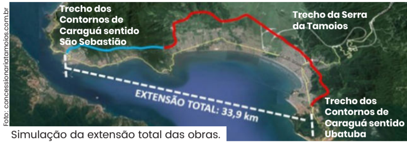
Simulação da extensão total das obras.