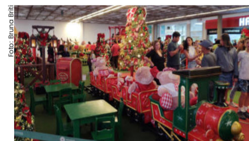
Praça de Eventos do Serramar Shopping decorado para o Natal.

Atrações do Natal já encantam Caraguá Praia Shopping e Serramar, além da programação de fim de ano que conta com Festival de Botecos, Show Tom Jobim e Seu Jorge