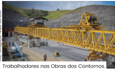
Trabalhadores nas Obras dos Contornos.

Com investimento de R$ 1,5 bilhão, as obras de todo o Contorno foram retomadas em setembro de 2021.