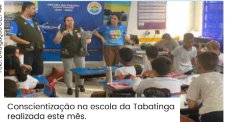
Conscientização na escola da Tabatinga realizada este mês.

O projeto ‘Água Limpa + Saúde, O Rio Tabatinga tem cura!’, coordenado pelo CEEPAM (Centro Educacional e Ecológico de Proteção Ambiental), engaja ambientalistas e comunidade em várias ações que acontecem neste mês nos bairros da Tabatinga em Caraguá e Galhetas em Ubatuba, sendo o Rio Tabatinga a divisa entre os dois municípios. As ações visam preservar e despoluir o rio, desde a nascente, até a sua foz nas praias da Tabatinga e Galhetas.