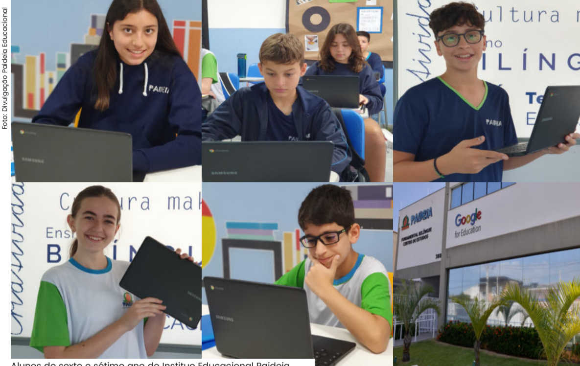
Alunos do sexto e sétimo ano do Instituto Educacional Paideia.

Alinhado às tendências e demandas educacionais contemporâneas da nova era da educação, o Instituto Educacional e Cultural PAIDEIA, instituição que atua na área educacional desde 2009 em Caraguatatuba, anunciou a parceria com a plataforma Geekie One, a primeira plataforma de educação baseada em dados do Brasil. Trata-se de uma grande oportunidade para que os estudantes fiquem cada vez mais no centro de uma educação de excelência, repleta de possibilidades que se abrem com essa inovação.