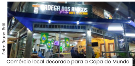
Comércio local decorado para a Copa do Mundo.

O Brasil respira e vive a expectativa para a conquista do Hexacampeonato Mundial de Futebol na Copa do Qatar. No Litoral Norte, empresários e comerciantes apostam na Seleção do técnico Tite para garantir um lucro extra, além de comemorar o possível título inédito e proporcionar alegria ao povo. O evento esportivo também abre oficialmente o período que antecede as festas do fim de ano e o período das férias de verão.