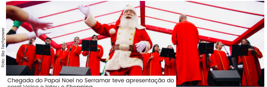
Chegada do Papai Noel no Serramar teve apresentação do coral Voice e lotou o Shopping.

Toda a magia do Natal já marca presença nos corredores e lojas do Serramar Shopping. Este ano a decoração apresenta o mundo encantado "Natal dos Ursos". Foi investido nas atrações de final de ano mais de R$ 700 milhões na Decoração de Natal, bem como na Campanha "Natal Presente" que sorteia um FiatPulse 0km, além do Papai Noel que atenderá as crianças a partir de dezembro.