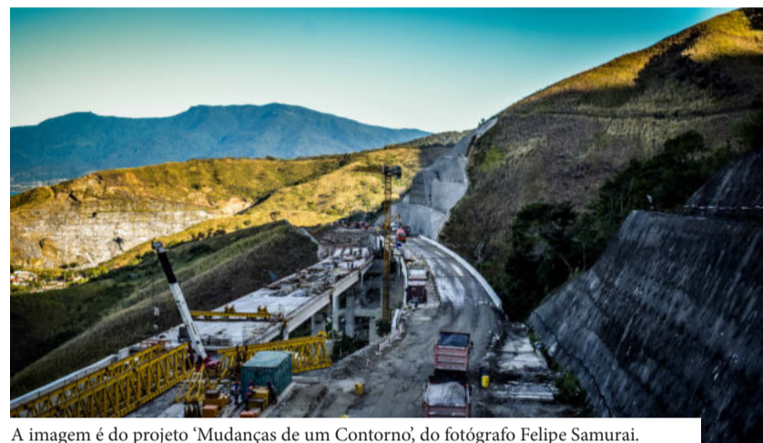
A imagem é do projeto 'Mudanças de um Contorno', do fotógrafo Felipe Samurái.

Atrações do Natal já encantam Caraguá Praia Shopping e Serramar, além da programação de fim de ano que conta com Festival de Botecos, Show Tom Jobim e Seu Jorge