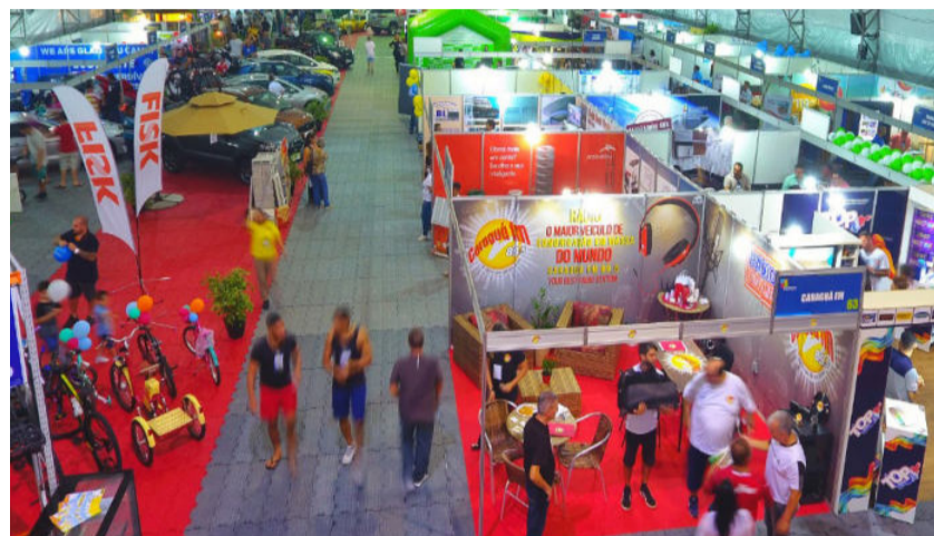
Empresas locais dominaram o cenário do Empreenda Caraguá 2021.