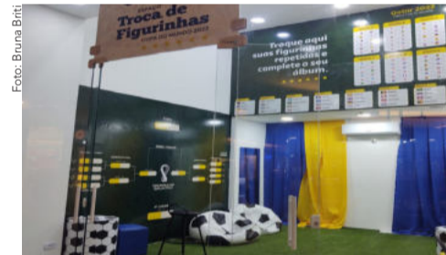
Os colecionadores de figurinha do álbum da copa podem se juntar nesse espaço preparado pelo Serramar Shopping para realizar trocas.

Se você tem figurinhas repetidas do álbum da copa, o Serramar Shopping preparou um espaço exclusivo para troca de figurinhas que fica próximo à loja Brasil Cacau. Essa atividade segue até dia 18 de Dezembro, das 10h às 22h. É só juntar a galera e se divertir! E torcer para o Brasil conquistar o Hexacampeonato mundial.