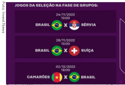
Quadro da 1ª fase do torneio para vaga para as oitavas de final.

Falta pouco para a Copa do Mundo do Qatar começar no dia 21 de novembro. Por enquanto, o que está mexendo com o imaginário dos brasileiros é o álbum de figurinhas da Copa, oficial da FIFA, que virou febre no país todo e no mundo!