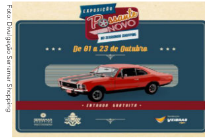
Exposição 'Possante Novo' no Serramar Shopping.

Além da programação do ‘Possante Novo’, o Mall conta com a Feira do Livro com vários títulos com preços imperdíveis, localizada na Praça de Eventos. E em alusão a Campanha Outubro Rosa toda fachada do Shopping está iluminada com a cor projetando luz sobre a prevenção do câncer de mama.