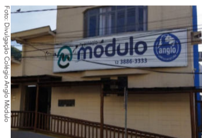
Colégio Anglo Módulo com matrículas abertas para 2023

As matrículas para o próximo ano, tanto para o Ensino Fundamental como para o Ensino Médio, estão abertas no Anglo Módulo Caraguá. O papel do sistema Anglo é construir um mundo ainda melhor, com o método de ensino que foca no desenvolvimento do aluno em sala de aula, e na sua formação de valores. O estudante aprende a se tornar protagonista das mudanças.