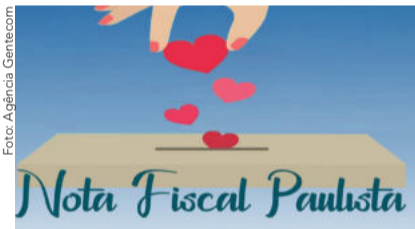
Campanha de doação para Casa de Saúde Stella Maris.

Você sabia que é possível doar seu cupom fiscal para a Casa de Saúde Stella Maris, principal hospital do Litoral Norte? E o melhor: o valor arrecadado nas doações é utilizado para promover melhorias na instituição que recebe o apoio do Serramar Shopping nessa iniciativa.