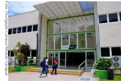
Centro Universitário Módulo contará com diversas palestras.

O Centro Universitário Módulo de Caraguá realiza a ‘Semana de Responsabilidade Social’ do dia 17 a 21/10. A iniciativa também ocorre nas maiorias das Unidades da Cruzeiro do Sul, que conta com palestras abertas ao público, e sem necessidade de inscrição prévia, de diferentes assuntos cujo o foco central é a temática do evento.