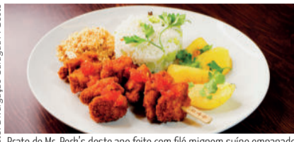
Prato do Mr. Pork's deste ano feito com filé mignon suíno empanado

Delícias do Espeticho, Mr. Pork's e Taller Gastronomía, que integram a Praça de Alimentação do Serramar Shopping, estão participando do 17º Caraguá A Gosto que segue até 4 de setembro! O festival gastronômico organizado pela Secretaria de Turismo de Caraguá, conta com a participação de 58 estabelecimentos, que juntos, oferecem mais de 90 pratos, em nove categorias, vendidos nos formatos presencial, delivery e drive-thru.