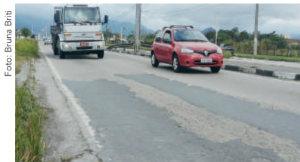
Trecho da Rodovia Rio Santos próximo ao Serramar Shopping apresenta buracos e irregularidades na pista.

A segunda fase do Programa Estrada Asfaltada foi liberada no último dia 19 de maio pelo governador Rodrigo Garcia. Com investimentos de mais de R$ 2,9 bilhões em melhorias para rodovias de todo