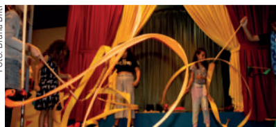
Os espetáculos acontecem sempre aos sábados, às 19h, com diferentes companhias de renome

"Brincadeira de Circo" acontece diariamente até 19 de junho, na Praça de eventos em frente ao Habib's, no Serramar com programação diária diversa voltada para crianças de 4 a 12 anos e totalmente gratuita. As oficinas de Circo, sempre das 13h às 19h30, com sessões de 30 minutos cada, contemplam atividades como: Malabarismo com Bolinhas; Equilíbrio com Pratinhos; Equilíbrio com Rola-Rola; Perna de Pau; Cama Elástica; Chinêlo; Jogos de Fitas.