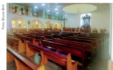
Dia 16, no feriado de Corpus Christi terá confecção dos tapetes decorados a partir das 6h e Missa e Procissão às 17h.

Após dois anos com restrições, a Diocese de Caraguatuba comemora o retorno da Festa de Santo Antônio, padroeiro da cidade, de modo 100% presencial. Em sua 169ª edição, a tradicional comemoração tem como tema “É viva a palavra quando são as obras que falam” e segue até o dia 26 de junho.