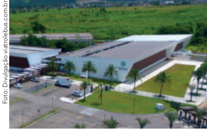
Cerca de 5 mil pessoas circulam pelo Mall durante a semana, chegando a 20 mil pessoas nos finais de semana

A expansão do Serramar é uma realidade! O Grupo Serveng anunciou recentemente, investimentos na casa dos R$ 100 milhões na área do entorno do Shopping, incluindo a implantação de um hotel, academia, restaurantes e lojas de diferentes serviços. A estimativa de conclusão de mais 50 lojas (hoje são 100), é de aproximadamente 18 meses, portanto até o final de 2023. E até o final de 2024, o shopping deve chegar a 200 lojas!