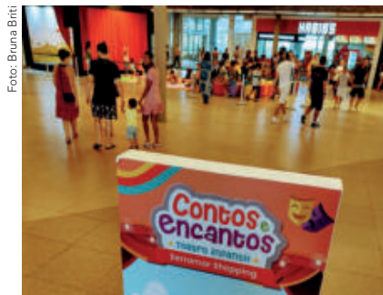
A Mostra "Contos e Encantos" teve início em 19/03 levando alegria para a criançada nos finais de semana.

Os clientes que circularem no final de semana, de 15 a 17 de abril, vai se encantar com as peças teatrais da Trupe "Lacuna de Variedades". Às 15h, da sexta-feira santa, 15/04 tem a peça "Dois coelhos atrapalhados"; no sábado, 16/04 tem "Os coelhos em um dia de travessura", e no domingo de Páscoa, dia 17/04, tem "Coelhos da Páscoa".