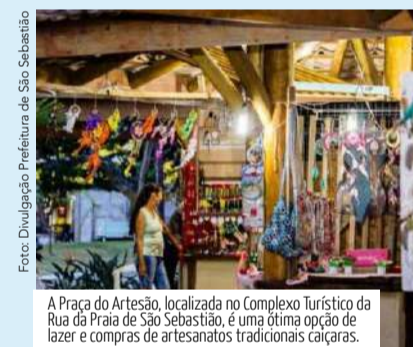
A Praça do Artesão, localizada no Complexo Turístico da Rua da Praia de São Sebastião, é uma ótima opção de lazer e compras de artesanatos tradicionais caiçaras.

Ilhabela - Com o charme de uma cidade pequena, a ilha reúne praia e montanha. Para quem curte natureza e mar, são mais de 40 praias. Além disso, com 83% de Mata Atlântica preservada, o Parque Estadual de Ilhabela tem atrações de ecoturismo. Mais de 20 cachoeiras e piscinas naturais, trilhas pela mata, e uma rica flora e fauna para apreciar. O Centro Histórico de Ilhabela, mais conhecido como Vila, tem lojas diversas, restaurantes, calçadões e decks. Para quem curte badalação, bares com mesas na calçada oferecem diversas opções de cardápio e drinks, além de música ambiente ou ao vivo.