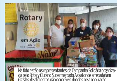
Na foto estão os representantes da Campanha Solidária organizada pelo Rotary Club no Supermercado Assai onde arrecadaram 623 kg de alimentos não perecíveis doados pela população.

Nos dois primeiros sábados deste mês de dezembro, os representantes da Campanha Solidária organizada pelo Rotary Club de Caraguá arrecadaram mais de 330 kg de alimentos não perecíveis. A ação contou com o apoio do Supermercado Assai que permitiu que os rotarianos arrecadassem os alimentos que a população doou no estabelecimento.