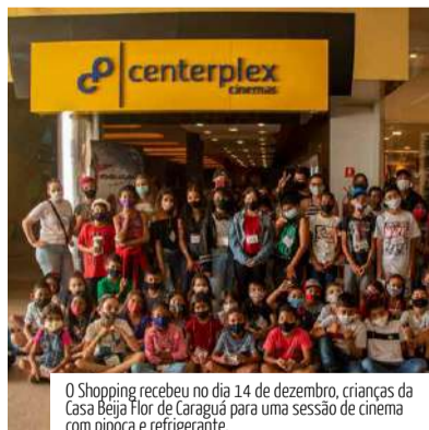
O Shopping recebeu no dia 14 de dezembro, crianças da Casa Beija Flor de Caraguá para uma sessão de cinema com pipoca e refrigerante.

O Serramar Shopping recebeu no último dia 14 de dezembro, 250 crianças da Casa Beija Flor de Caraguá, que desfrutaram de uma sessão de cinema com pipoca e refrigerante, além de tirarem fotos com o papai Noel. Desde o início deste ano de 2021, o Serramar "adotou" as quatro Casas Beija-Flor de Caraguá, que acolhe crianças, jovens e famílias em situação de vulnerabilidade socioeconômica, numa ação solidária permanente que inclui doações de mais de 320 cestas básicas de agosto a novembro e mais de 150 cobertores.