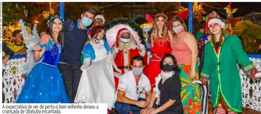
A expectativa de ver de perto o bom velhinho deixou a criança de Ubatuba encantada.

Ah! O Natal! Uma data alegre para compartilhar emoções, carinho, bondade e afeto. Quando essa época se aproxima, o espírito solidário costuma revigorar. A data sensibiliza as pessoas criando um cenário de luz tanto exterior, com decorações natalinas, como interior, de reavaliação e nobreza nos atos. Muitas ações são colocadas em prática, seja para alimentar a fantasia e entreter crianças e adultos, seja para ajudar os mais necessitados.