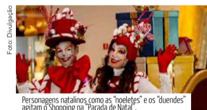
Personagens natalinos, como as "noeletes" e os "duendes" agitam o Shopping na "Parada de Natal".

Quem visitar o Serramar Shopping neste sábado e no próximo, dias 18 e 19 de dezembro, das 14h às 19h, vai aproveitar "em grande estilo", o clima de festividades de final de ano! Na "Parada de Natal", feita especialmente para as crianças e as famílias, vai ter banda para animar ainda todos que frequentam o shopping, além de personagens natalinos como as "noeletes" e os "duendes" que vão distribuir balões, bem como o "urso gigante" e o Mickey no dia 18. Ótima dica para fazer aquela foto bonita!