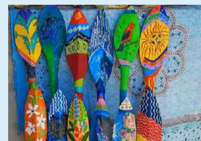
As peças expostas são produzidas por artesãos locais, que participaram da Mostra de Saberes Artesanais do Litoral Norte.

A exposição conta com peças de artesãos das comunidades tradicionais caiçaras, indígenas e quilombolas, além de artesãos que mesclam os saberes tradicionais com a contemporaneidade. Os horários para visitação são das 11 às 17 horas de segunda a quinta-feira, e das 16 às 21 horas, de sexta a domingo.