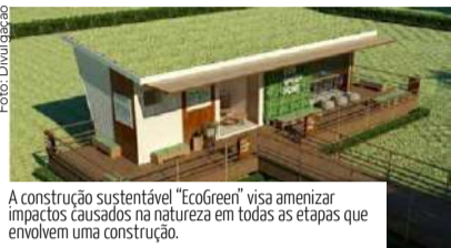
A construção sustentável "EcoGreen" visa amenizar impactos causados na natureza em todas as etapas que envolvem uma construção.

O "Eco Green Home" é um projeto da DA de Oliveira Soluções Sustentáveis. Diferenciado, a iniciativa está toda direcionada para as novas tendências da construção civil aplicado ao conceito de sustentabilidade. O escritório de arquitetura e engenharia sustentável ficará instalado onde funcionava o Playground, próximo da Caixa Econômica, no Serramar Shopping, parceiro do projeto, e será construído um deck de madeira de plástico para chegar até o local.