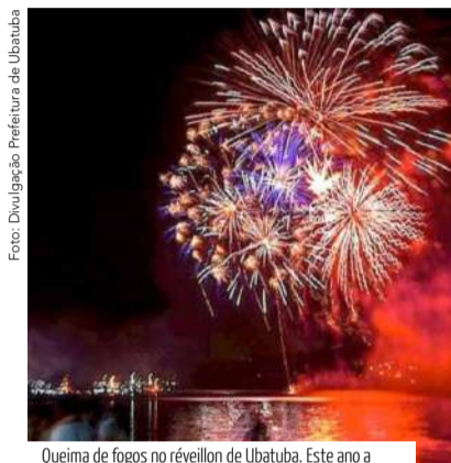
Queima de fogos no Réveillon de Ubatuba. Este ano a cidade é a mais procurada pelos brasileiros para as festas de fim de ano em 2021.

Caraguatatuba - A Prefeitura confirmou que não haverá queima de fogos no próximo dia 31 de dezembro, evitando aglomerações. Este é o segundo ano consecutivo que a queima de fogos é cancelada, assim como foi em 2021 devido à pandemia. A cidade mantém todos os protocolos sanitários e infraestrutura necessária para receber o turista neste período de final de ano e festas escolares sem grandes shows, nem carnaval. O prefeito Aguilár Junior explica que não haverá investimento público em festividades durante o carnaval, que também foi cancelado, assim como em outras cidades do Vale do Paraíba.