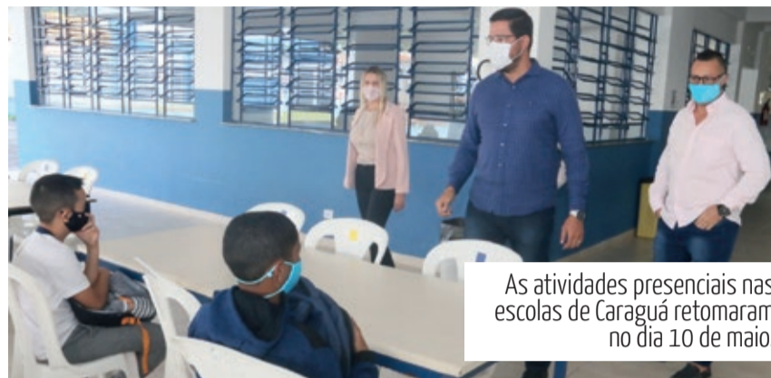
As atividades presenciais nas escolas de Caraguá retomaram no dia 10 de maio.