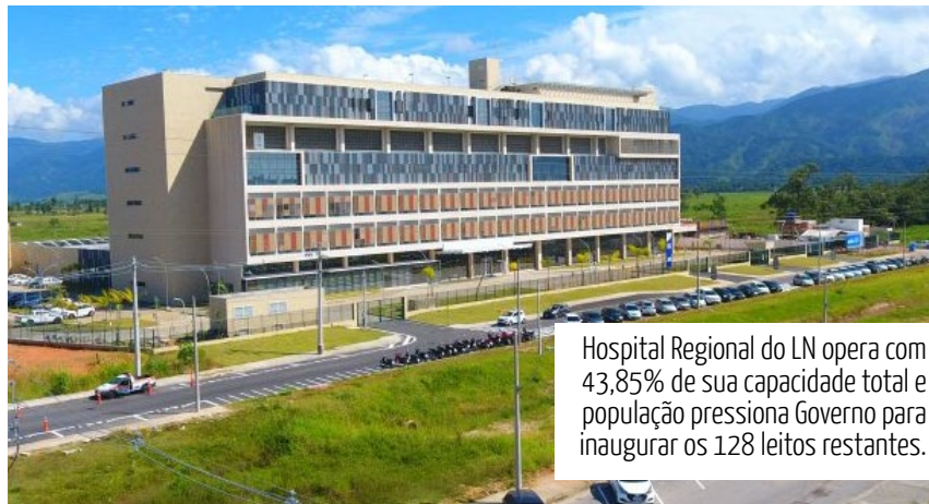
Hospital Regional do LN opera com 43,85% de sua capacidade total e população pressionada Governo para inaugurar os 128 leitos restantes.

São 40 leitos de UTI (Unidade de Terapia Intensiva) voltados para pacientes graves com COVID-19 e 60 leitos de Enfermaria.