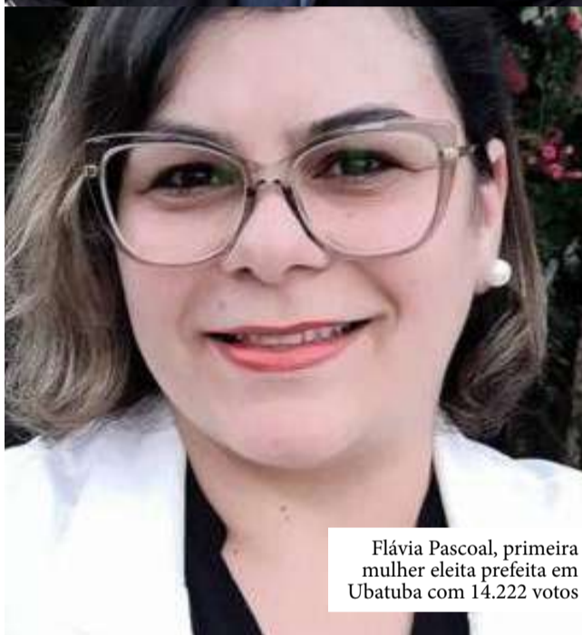
Flávia Pascoal, primeira mulher eleita prefeita em Ubatuba com 14.222 votos