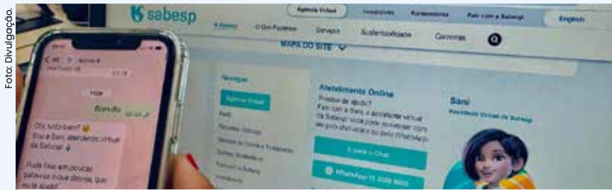
Inclusão de novas opções de pagamento e a ampliação de canais digitais tornam o atendimento ao cliente mais rápido e fácil.

A Sabesp está inovando e modernizando seus canais para oferecer um atendimento mais prático e ágil. A reestruturação dos canais de relacionamento é focada em melhorias nos serviços presenciais e, principalmente, nos digitais. Para quem busca resolver tudo online, a Agência Virtual está disponível 24 horas por dia, no endereço agenciavirtual.sabesp.com.br . Nela, é possível realizar atualizações cadastrais, além de pedir a religação de água e informar pagamentos.