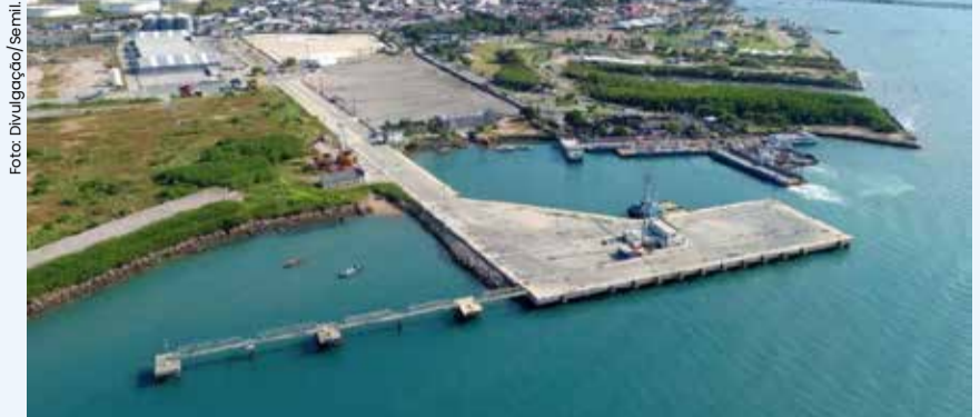
O novo acesso, que tem previsão para ser concluído em março de 2026, criará uma rota exclusiva para caminhões, conciliando o transporte de cargas com o fluxo de turistas.

Após intensas tratativas conduzidas pela Prefeitura de São Sebastião, o Governo do Estado de São Paulo oficializou a assinatura do termo aditivo ao contrato de concessão da Rodovia dos Tamoios, viabilizando a construção de um novo acesso direto ao Porto de São Sebastião.