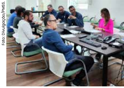
Com o projeto, a cidade buscará qualificar a mão de obra local, atrair startups e consolidar um polo de pesquisa e desenvolvimento para o setor de logística.

A Prefeitura de São Sebastião, por meio das Secretarias de Planejamento (Seplan) e Governo (Segov), avançou em mais uma etapa decisiva para fortalecer a integração entre cidade e porto. Em reunião realizada no último dia 29 de agosto, com a Companhia Docas, a Faculdade de Tecnologia (Fatec) e a Fundação Parque Tecnológico de Santos (FPTS), foram definidas as cláusulas do termo de cooperação técnica que formalizará a criação do Centro Tecnológico de São Sebastião, voltado ao desenvolvimento de soluções para logística portuária e inovação.