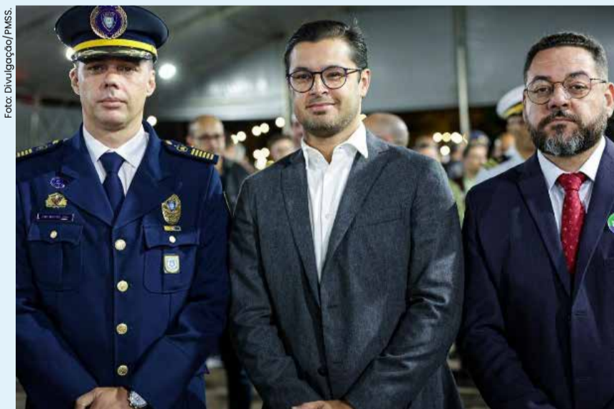
A cerimônia de posse, que lotou a Rua da Praia, celebrou a realização de um sonho para os policiais e suas famílias, além de ser um marco na ampliação da segurança na cidade.

O primeiro dia do mês de setembro foi marcado por muita emoção e conquista com a posse dos 62 novos policiais municipais de São Sebastião, que passaram a integrar a corporação. Com o recinto da Rua da Praia lotado de familiares e demais convidados, os integrantes também foram recepcionados pelo prefeito Reinaldo Moreira, deputados estaduais, prefeitos, vice-prefeitos, vereadores, autoridades policiais e de outras cidades.