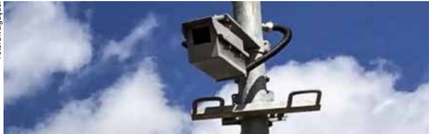
O equipamento é capaz de fiscalizar a velocidade, contar eixos e transmitir dados em tempo real, reforçando a segurança nas rodovias da região.

O Departamento de Estradas de Rodagem (DER-SP) anunciou que, desde a última terça-feira (02/9) um dos 25 radares previstos para a região do Litoral Norte já começou a operar. O equipamento está instalado no km 137,15 da rodovia Rio-Santos (SP-055), localizado nas proximidades do bairro Guaecá, em São Sebastião, e tem velocidade máxima de 40 quilômetros por hora.