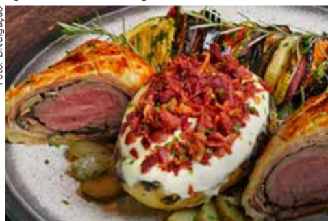
19º Caraguá a Gosto agita o Litoral Norte, ervindo delicias gastronômicas em 11 categorias, até 08 de setembro.

Se você busca dicas para os finais de semana e para curtir os eventos no Litoral Norte, aproveite e deguste alguns dos deliciosos pratos que estão concorrendo no 19º Caraguá a Gosto, que segue até 8 de setembro, com 102 pratos concorrendo em diversas categorias. Tem também o 29º Festival do Camarão de Ilhabela, que continua até o final deste mês; o Festival da Cultura Japonesa, que acontece de 12 a 15/09, em São Sebastião; e também o 15º Festival Gastronômico de Ubatuba "Sabor Caiçara 2024", até 15/09. Confira nossa Agenda Cultural!