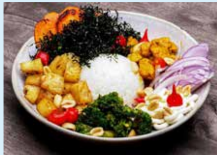
Iniciada a temporada do Caraguá a Gosto!

No Litoral Norte os eventos não param! Todos os meses as quatro cidades, Ubatuba, Caraguatatuba, São Sebastião e Ilhabela, disponibilizam diversas oportunidades de diversão e entretenimento para todas as idades. São festivais, eventos típicos, esportivos, culturais, sempre com boa música e muita comida gostosa. Confira nossa Agenda Cultural para ficar por dentro de todas as novidades e oportunidades de diversão durante o mês!