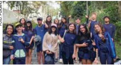
Alunos do Instituto Educacional e Cultural Paideia em atividades escolares.

O Instituto Educacional e Cultural Paideia de Caragatutuba tem uma agenda cheia de atividades para o segundo semestre de 2024, começando com a celebração do Dia dos Pais e participação em eventos esportivos como os Jogos Interescolares e o Festival de Jiu Jitsu. Além disso, os alunos participarão de eventos competitivos contra a Águia JJSCHOL, de Bragança Paulista.