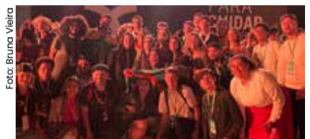
Brasil sediou as 3 fases do festival e comemora as sementes de mudança que continuarão a florescer em prol da construção de um mundo mais justo e solidário.

A cidade de Aparecida (SP) viveu dias históricos com a realização do Genfest 2024, um evento que reuniu mais de 4 mil jovens de 52 países em torno de um ideal comum: a fraternidade universal. Em sua 12ª edição, pela primeira vez na história, o encontro internacional promovido pelo Movimento dos Focolares foi realizado em país da América Latina, o Brasil, que acolheu com entusiasmo essa iniciativa.