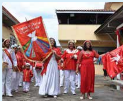
Festa do Divino Espírito Santo em Caraguatatuba.

O Litoral Norte segue oferecendo ótimas opções de diversão para moradores e veranistas. Confira as agendas culturais das quatro cidades e fique por dentro das novidades!