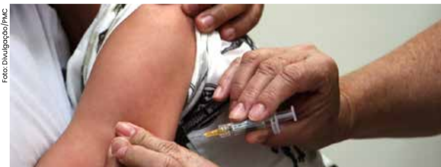
Vivenciando uma epidemia nos últimos meses, o número de casos confirmados de dengue ultrapassa 11 mil. Além disso, há o registro de quatro mortes e quatro mortes suspeitas que seguem em investigação na região.

O Litoral Norte passa a disponibilizar a tão aguardada vacina contra a dengue. O público-alvo, no momento, são crianças e jovens de 10 a 14 anos. Disponibilizadas nas Unidades de Saúde desde a segunda semana deste mês de maio, a vacina contra a dengue tem um esquema de duas doses com um intervalo de três meses, e tem como objetivo reduzir hospitalizações e óbitos pela doença.