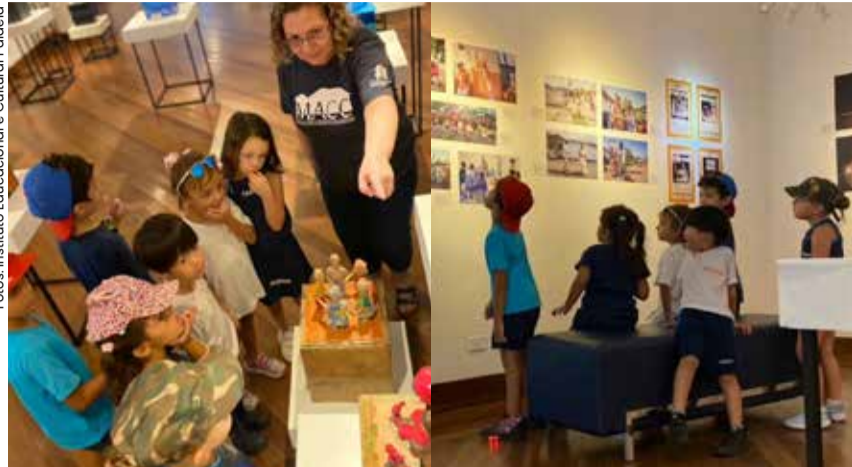
Alunos do pré 1 e 2 do Instituto Educacional e Cultural Paideia seguem com visitas aos espaços públicos de Caraguatatuba.

Com o intuito de apresentar aos alunos o cotidiano e o funcionamento de espaços essenciais para uma cidade, o Instituto Educacional e Cultural Paideia segue com seu programa de visita aos locais públicos com os alunos do pré 1 e 2, da unidade I, durante o mês de maio. Dentre as atividades programadas este mês, estão a visita a Biblioteca Municipal, ao Parque Estadual Serra do Mar e ao Museu de Arte e Cultural de Caraguatatuba – MACC.