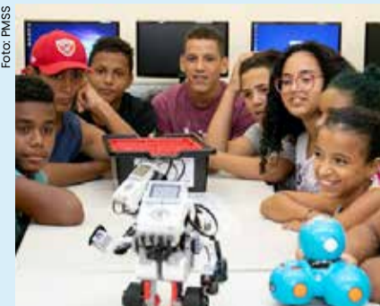
Aulas começaram no início de maio na Topolândia e Vila Amélia.

Novidade na rede de ensino municipal do Litoral Norte, São Sebastião agora ofertará aulas de robótica educacional aos estudantes do 1º ao 9º ano do Ensino Fundamental do município. O lançamento do programa ocorreu no último dia 14 de maio, no Teatro Municipal, com professores e alunos embaixadores da iniciativa.