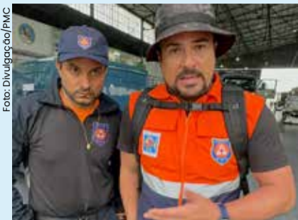
As quatro cidades do Litoral Norte entraram na onda de solidariedade neste momento difícil.

Enfrentando um dos piores desastres naturais da história brasileira, o Rio Grande do Sul, que desde 29 de abril é castigado por fortes chuvas e inundações, têm 447 municípios afetados, 127 desaparecidos, 806 feridos, 147 óbitos confirmados e mais 2 milhões de pessoas atingidas (até 14/5, fechamento desta edição).