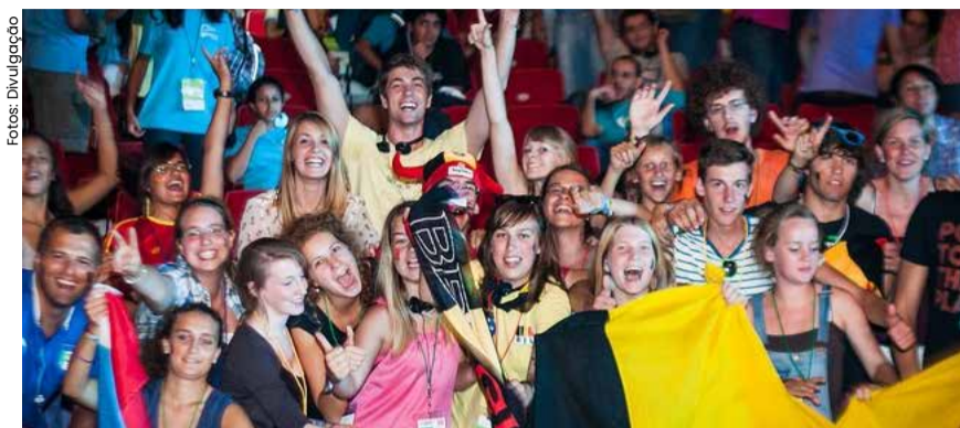
Jovens de todo mundo virão para Aparecida em julho de 2024 prestigiar este grande evento.

Um dos eventos mais aguardados de 2024 está em contagem regressiva! Em menos de 2 meses, jovens de todo o Brasil e do mundo estarão reunidos em Aparecida (SP), entre os dias 19 e 21 de julho, para celebrar o Genfest. Com o tema 'Juntos Para Cuidar', o festival juvenil espera receber 6.000 jovens, de 18 a 35 anos, vindos de 49 países. O Evento Central (2ª fase) terá transmissão para mais de 120 países, no qual milhares de jovens estarão reunidos para multiplicar a Fraternidade Universal. E o mais importante, ainda tem vaga para participar desta fase, basta acessar o site oficial: https://genfest.org/ e preencher seus dados para a adesão.