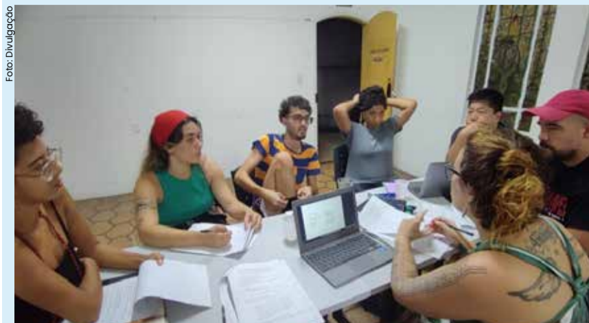
Equipe responsável pela curta-metragem reunida a trabalhar.