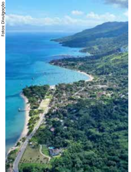
Iniciativa inovadora visa ampliar em 22% a oferta de água tratada no município

A Sabesp lançou uma licitação para a construir a primeira usina de dessalinização de água do Estado de São Paulo, localizada em Ilhabela. Essa iniciativa inovadora visa fornecer a água potável para mais de 8.000 habitantes do município - aproximadamente um quarto da população -, ampliando a resiliência hídrica de todo o sistema de produção e distribuição de água. Atualmente, Ilhabela dispõe de dois sistemas tradicionais: Pomba e Água Branca.