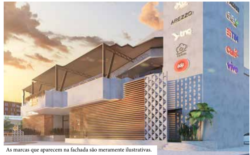
As marcas que aparecem na fachada são meramente ilustrativas.