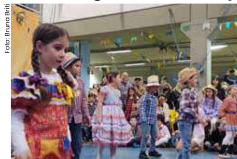
Alunos da escola Paideia na quadrilha da Festa Junina, uma das muitas que acontece na região.

Os casais - e os solteiros - contam com muitos eventos nas quatro cidades do Litoral. O Caraguá Praia Shopping celebra o Dia dos Namorados com a campanha 'Amor em cada mimo', já a campanha do Serramar Shopping é 'Por mais Momentos Juntos'. Na Festa de Santo Antônio, em Caraguá, há diversas atrações religiosas e social, bem como as festas juninas acontecem nas escolas e instituições como o Paideia. Em São Sebastião acontece o Festival de Camarão e o Arraiá Caiçara. Ilhabela tem Semana Internacional da Vela.