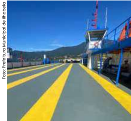
Interior da Balsa na Travessia de São Sebastião/Ilhabela.

A Secretaria de Meio Ambiente, Infraestrutura e Logística do Estado de São Paulo colocou recentemente em operação, a FB-29, com capacidade operacional para transportar 40 veículos e 140 pedestres, por viagem. Isso impacta diretamente na melhora da qualidade de vida e de milhares de usuários e muní-