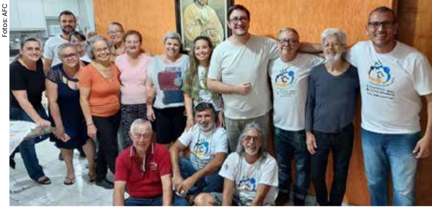
A Associação Acolhimento Fraternal Caiçara (AFC) apoia e acolhe pacientes em tratamento de diversas doenças, como o câncer, bem como dá abrigo aos seus acompanhantes.