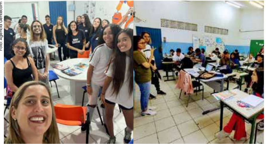
'Gentecom' contribuem há 11 anos com a área de comunicação no Litoral Norte e recebemos convites das escolas para falar mais sobre as carreiras na área de mídia e marketing.

A Agência de Publicidade 'Gentecom', sediada em Caraguá, completa 11 anos em julho próximo, sendo uma empresa consolidada em seu ramo, na região. Tem sua marca registrada no INPI (Instituto Nacional da Propriedade Industrial), e contribui para fortalecer a comunicação na região ao desenvolver produtos de comunicação e oferecer serviços. Exemplo disto, é o portal e jornal Litoral em Pauta , e a revista Litoral Up , além de otimizar resultados de seus clientes com Gestão de Mídias Sociais, Assessoria de Imprensa, Campanhas Publicitárias, Design e Diagramação, e muito mais! Para conhecer mais a agência, acesse www.gentecom.com.br e confira as soluções que a 'Gentecom' oferta.