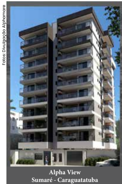
Alpha View Sumaré - Caraguatubá

A Alphamare já lançou 16 empreendimentos na região, sendo 15 em Ubatuba e 1 em Caraguá.