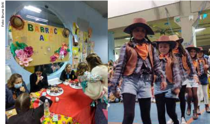
Alunos do Paideia na apresentação de quadrilha da Festa Julina do ano passado.

O Instituto Educacional e Cultural Paideia de Caraguá está preparado para uma das festas mais tradicionais do país: a Festa Julina que acontece no próximo dia 1º na escola! Com muita animação, música e brincadeiras típicas, o Paideia promove a cultura regional e estimula o aprendizado dos alunos de maneira lúdica e divertida.